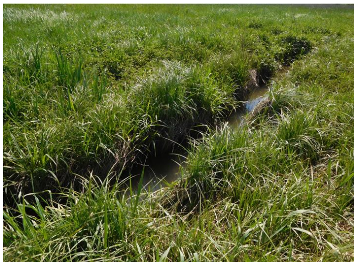
Foto des Querprofil-Messpunktes