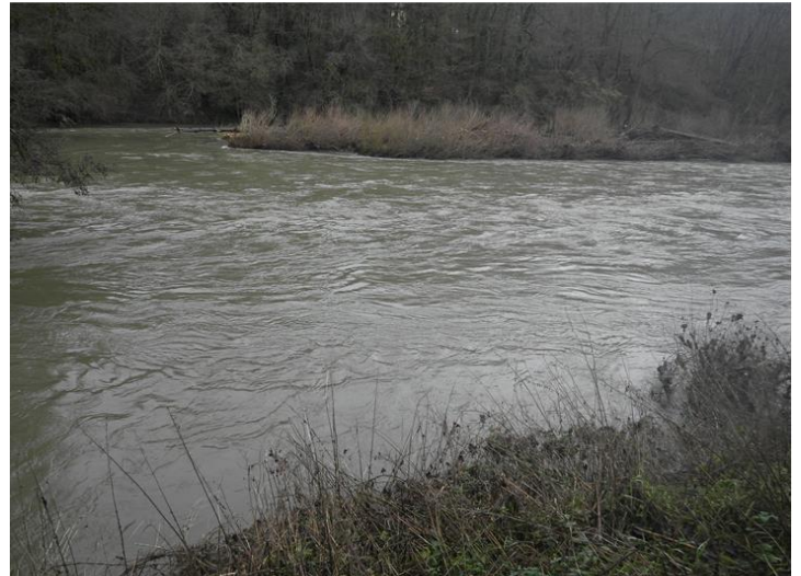
Foto des Querprofil-Messpunktes