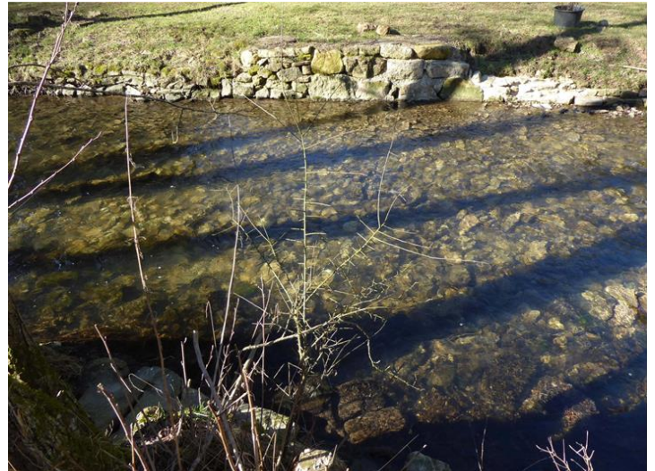
Foto des Querprofil-Messpunktes