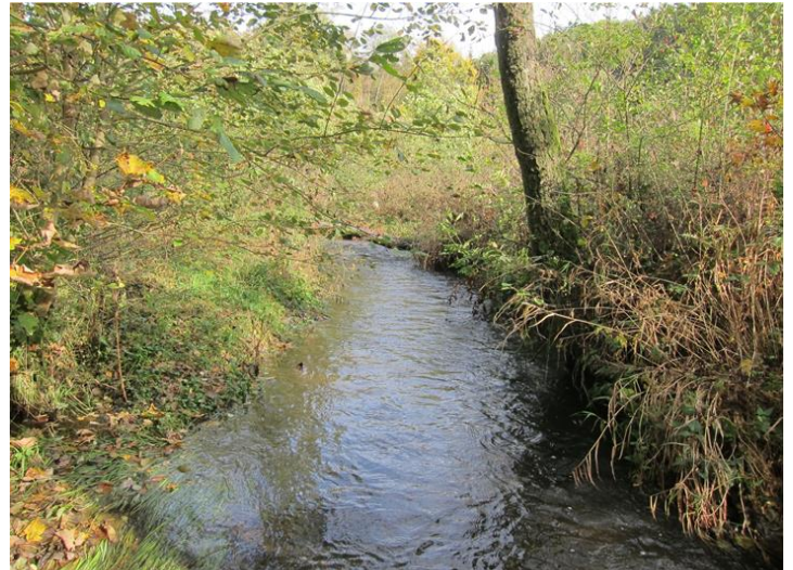
Foto des Querprofil-Messpunktes