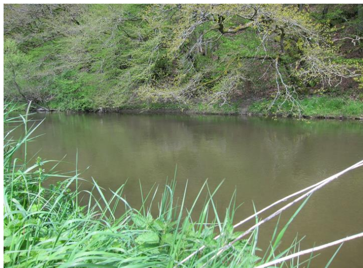
Foto des Querprofil-Messpunktes