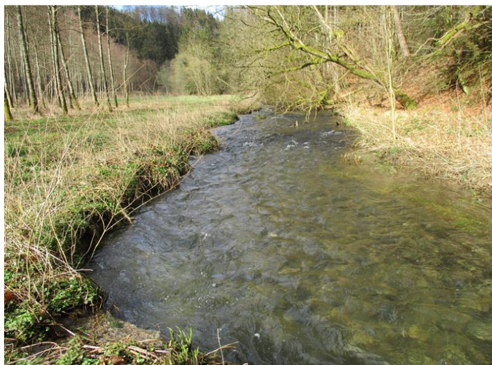
Foto des Querprofil-Messpunktes