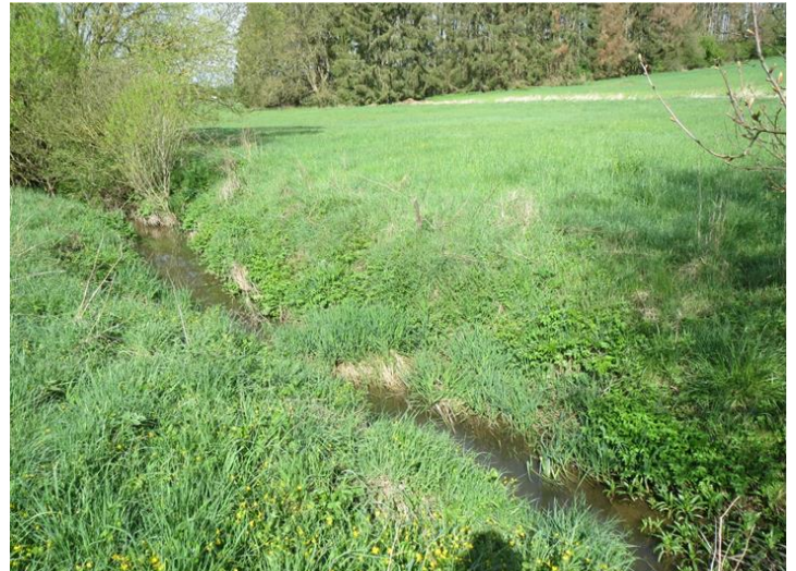
Foto des Querprofil-Messpunktes