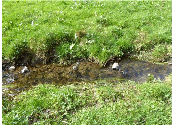
Foto des Querprofil-Messpunktes