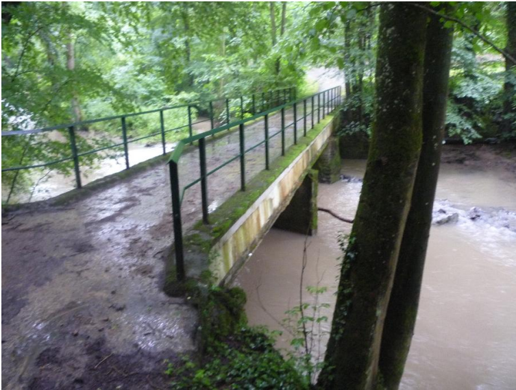
Durchlass; Ufer unterbrochen