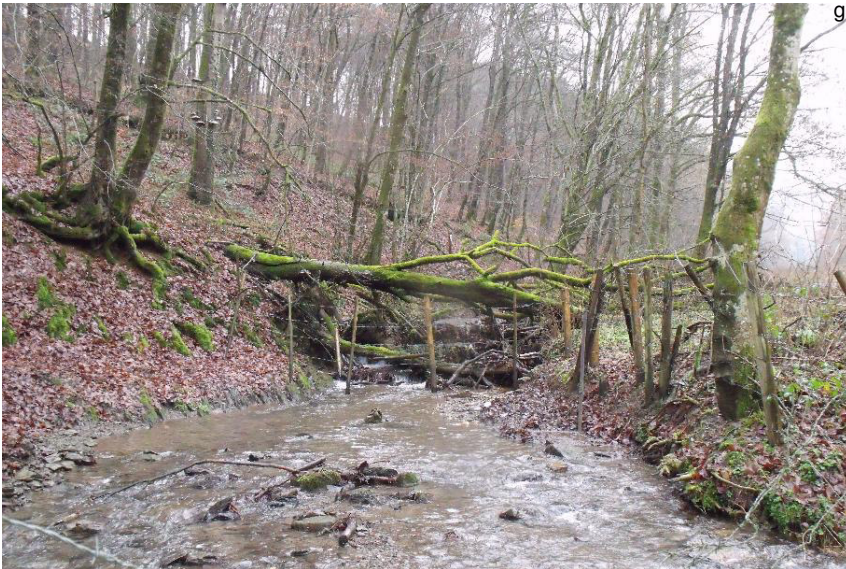
Durchlass; Lauf verengt