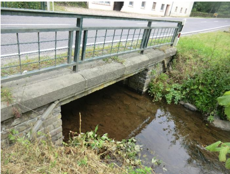
Durchlass; Ufer unterbrochen