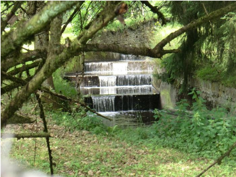
Absturz; sehr hoher