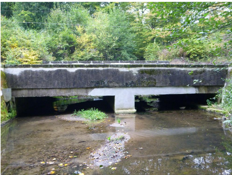
Durchlass; Ufer unterbrochen