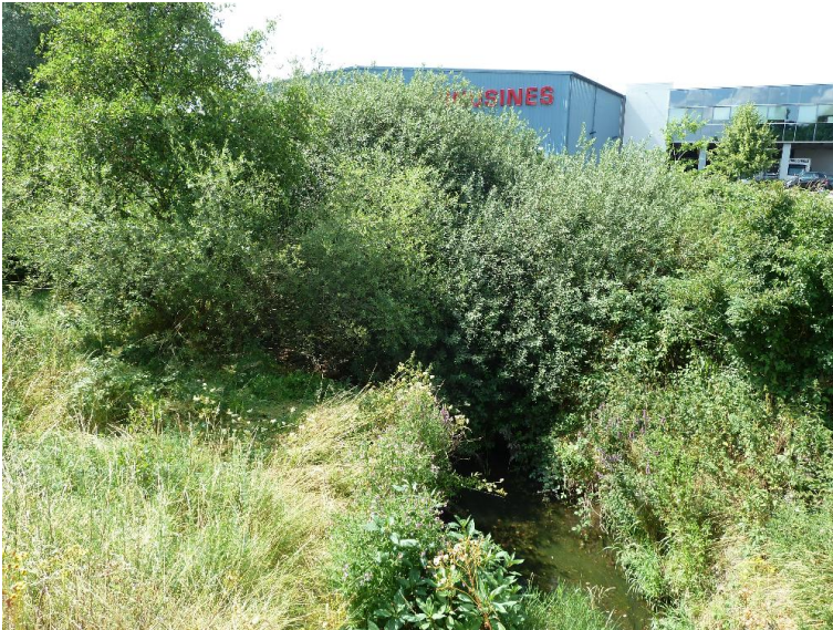
Gebuesch - Bebauung mit Freiflaeche