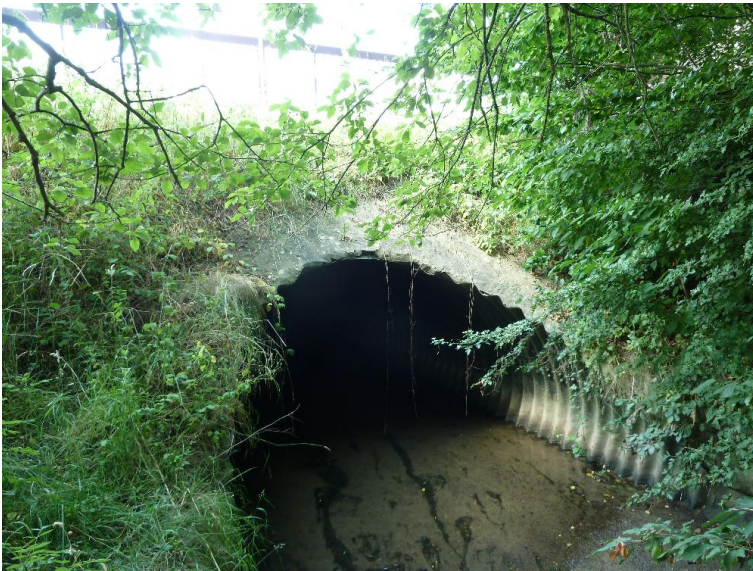
Durchlass; Ufer unterbrochen