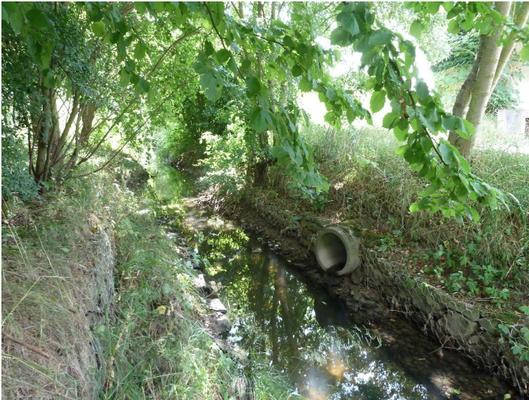
Einleitung - Uferverbau Steinsatz unverfugt