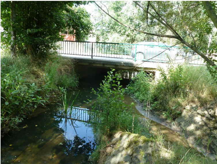
Durchlass; Ufer unterbrochen