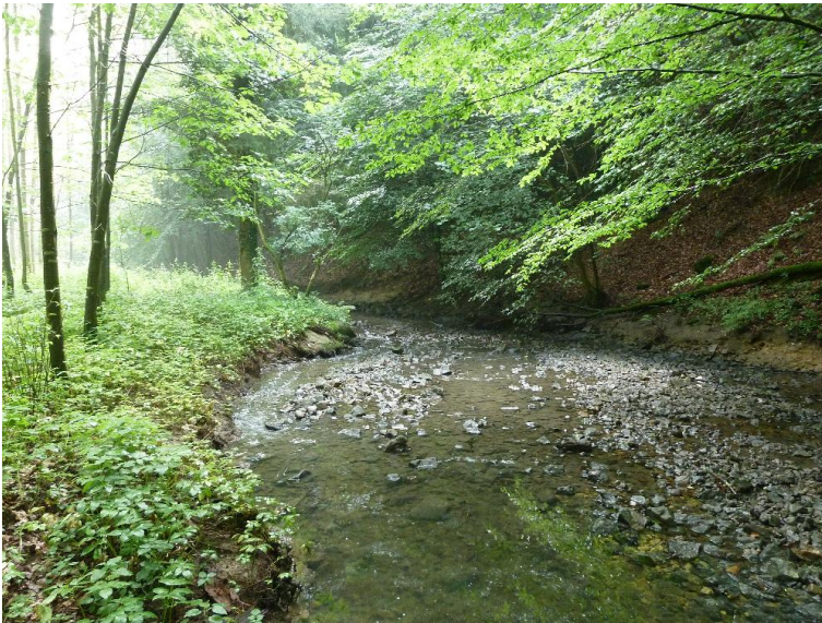
Tiefrinne, Tiefrippen - Rauschflaechen