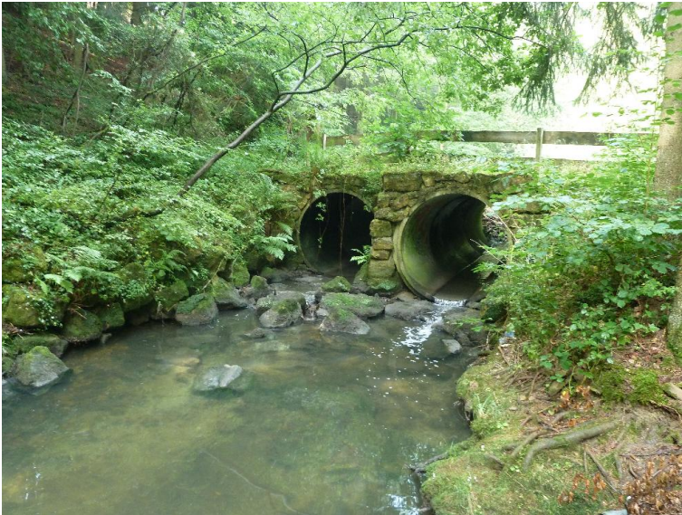
Absturz; kleiner - Durchlass; Lauf verengt