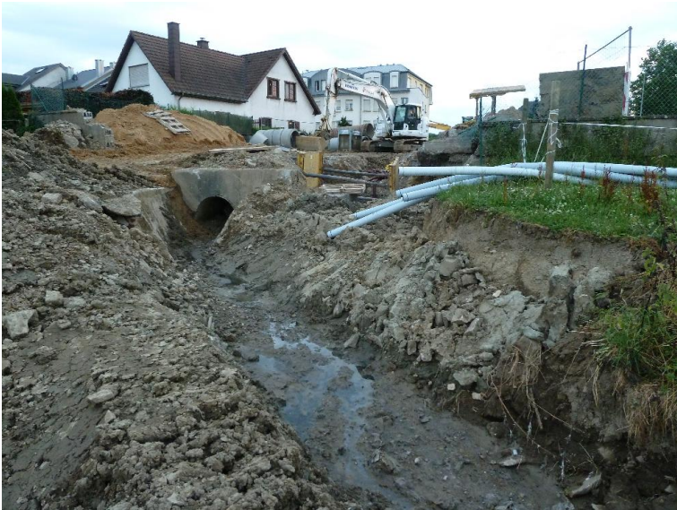
verrohrt bzw. ueberdeckt - Abgrabung - Restwasserpool