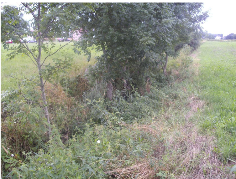
Lauf schwach geschwungen