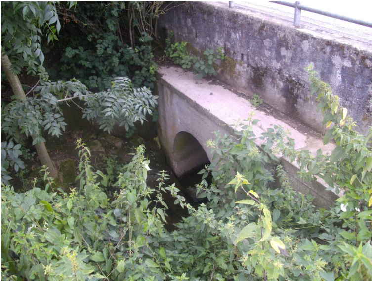
Durchlass; Lauf verengt