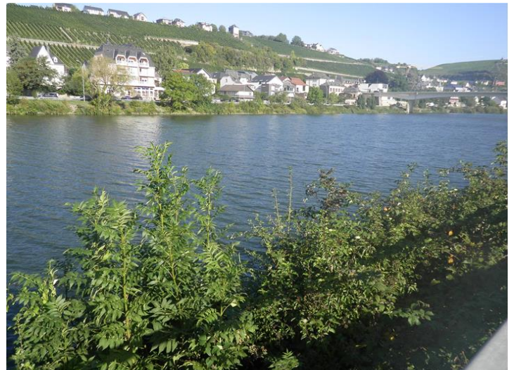
Foto des Querprofil-Messpunktes