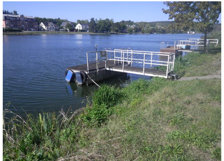
Foto des Querprofil-Messpunktes