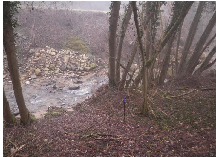
Foto des Querprofil-Messpunktes