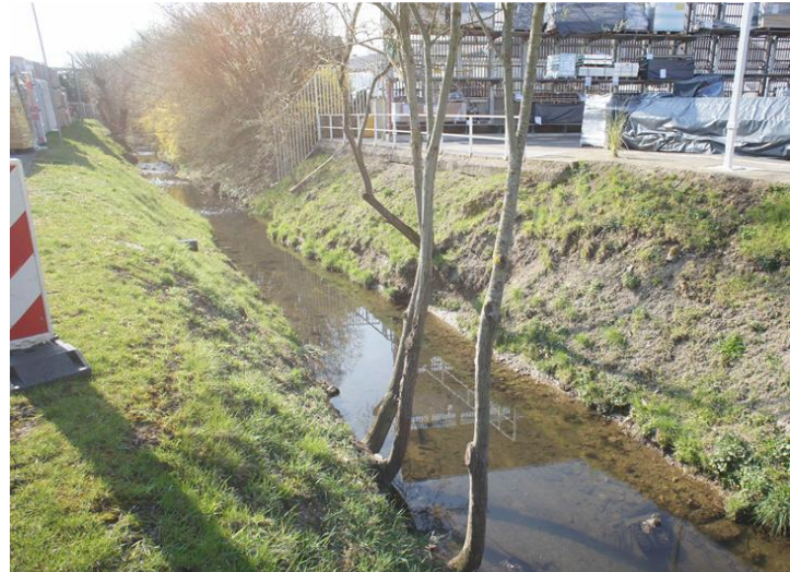
Foto des Querprofil-Messpunktes