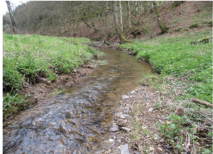
Foto des Querprofil-Messpunktes