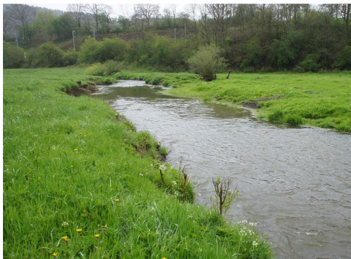
Foto des Querprofil-Messpunktes