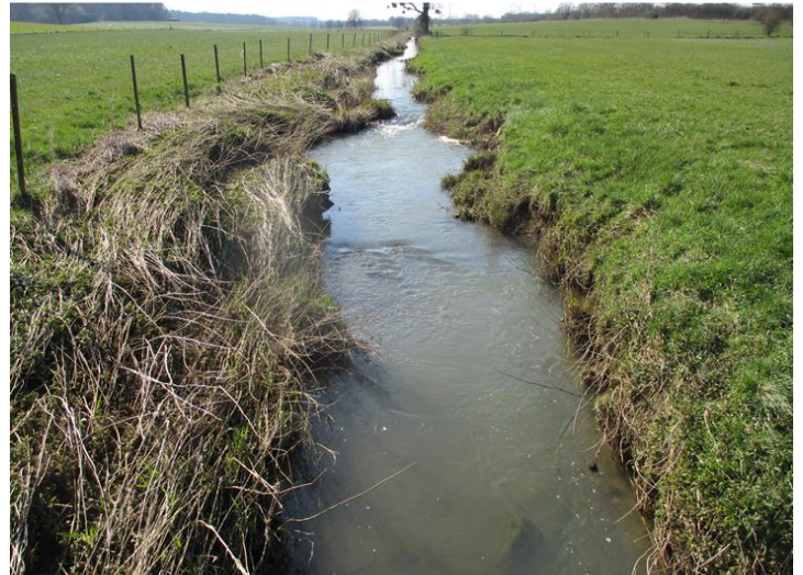
Foto des Querprofil-Messpunktes