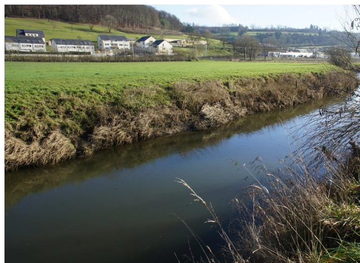
Foto des Querprofil-Messpunktes