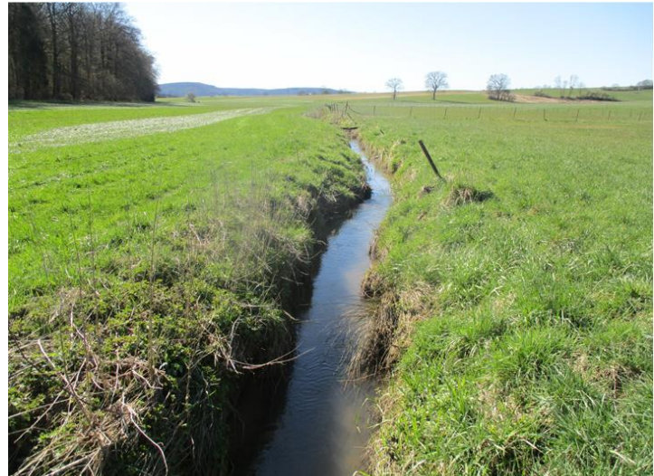
Foto des Querprofil-Messpunktes