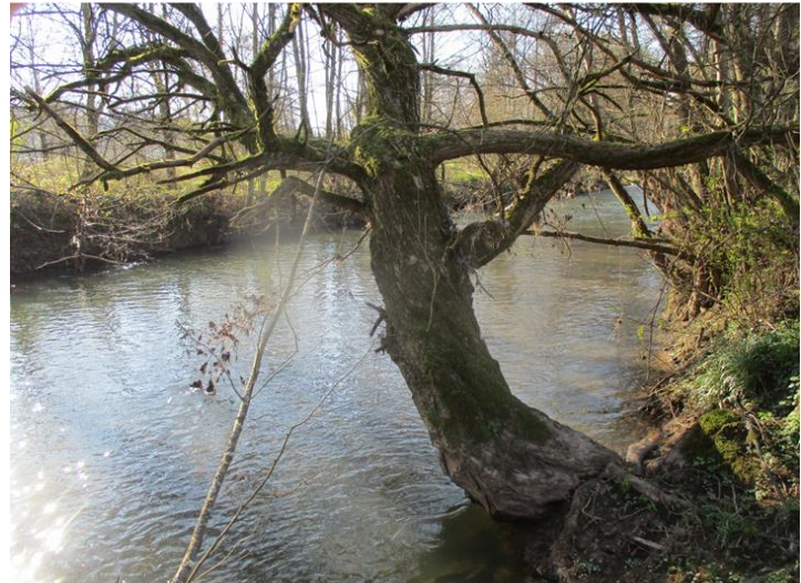
Foto des Querprofil-Messpunktes