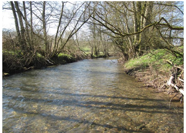
Foto des Querprofil-Messpunktes