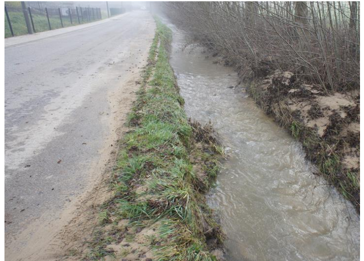
Foto des Querprofil-Messpunktes