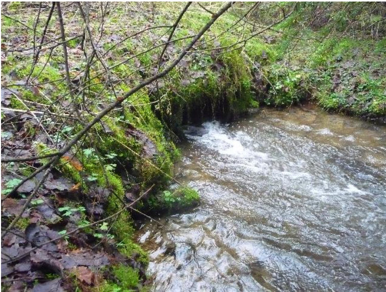
Durchlass; Ufer unterbrochen