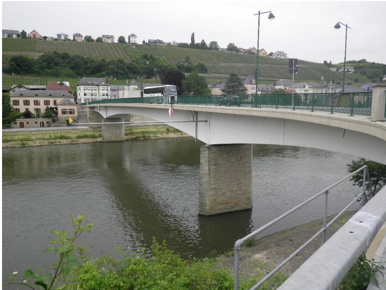
Durchlass; nicht strukturschädlich