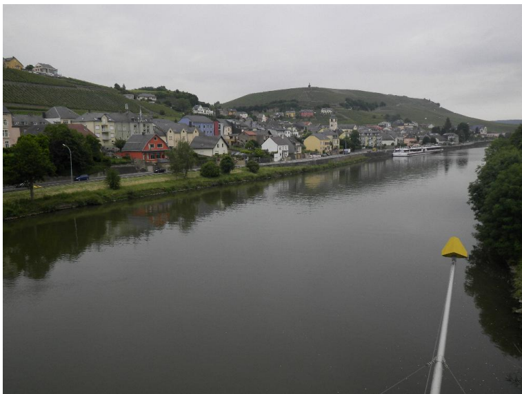
Bebauung mit Freifläche