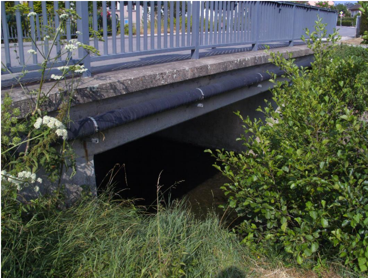
Durchlass; Ufer unterbrochen