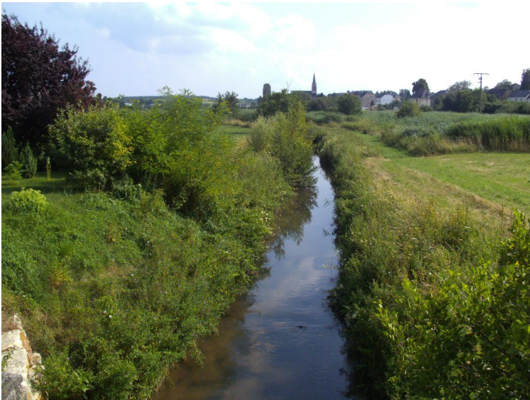
Lauf schwach geschwungen