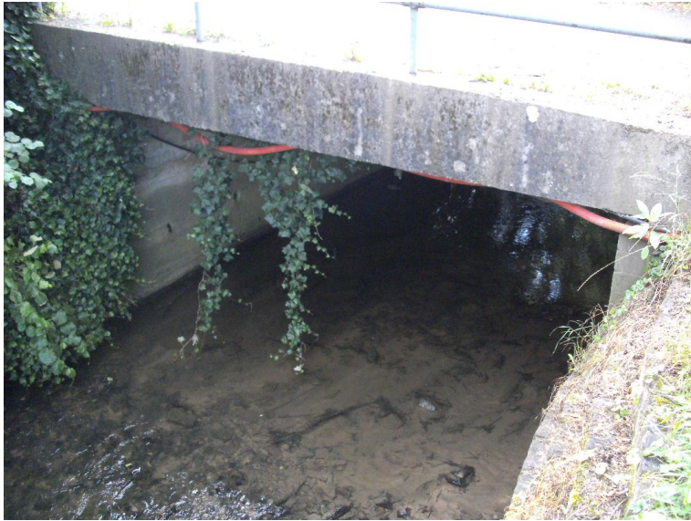
Durchlass; Ufer unterbrochen