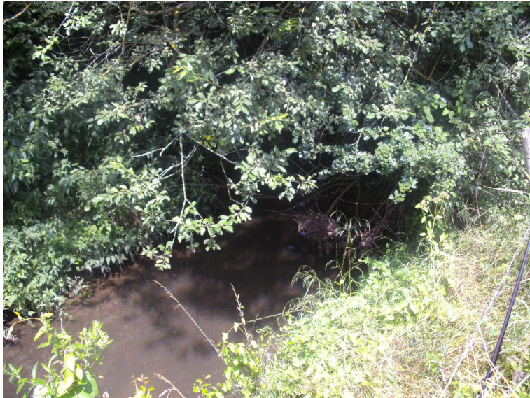
Lauf schwach geschwungen