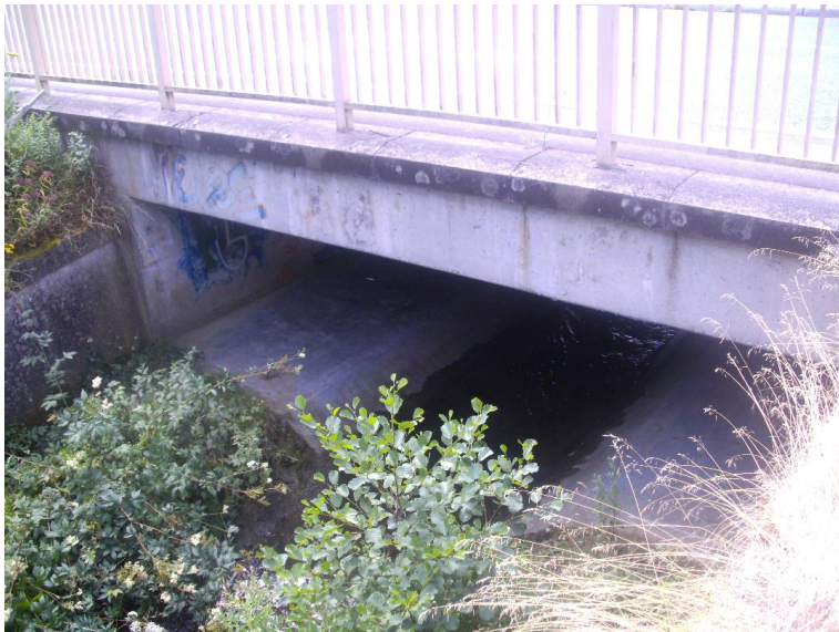
Durchlass; Lauf verengt