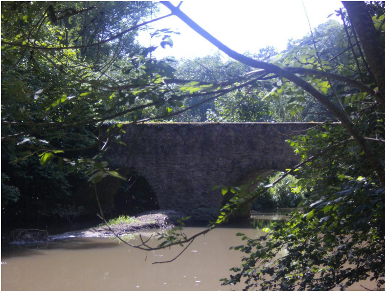
Durchlass; Ufer unterbrochen