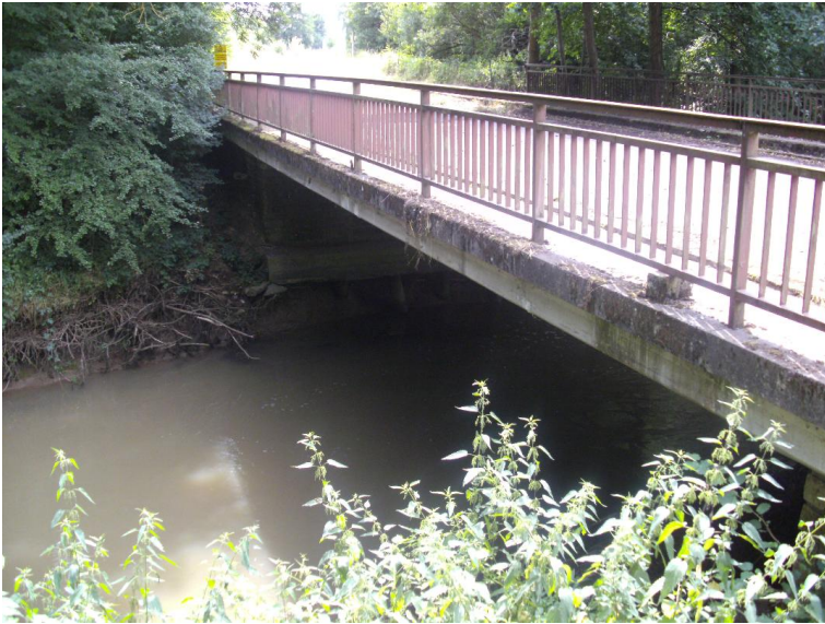
Durchlass; Ufer unterbrochen