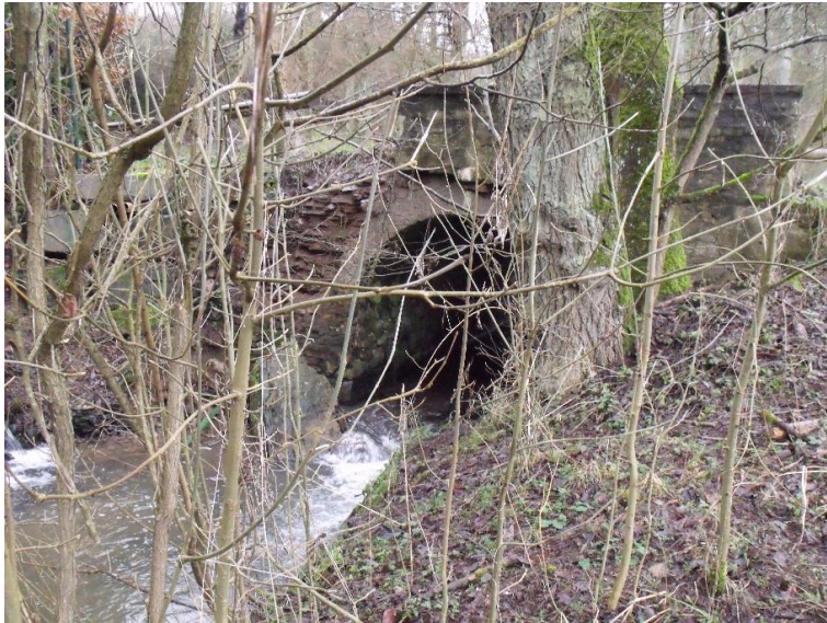
Durchlass; Lauf verengt