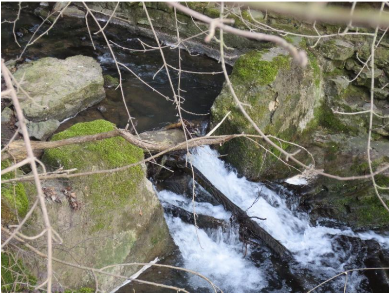
Durchlass; Lauf verengt