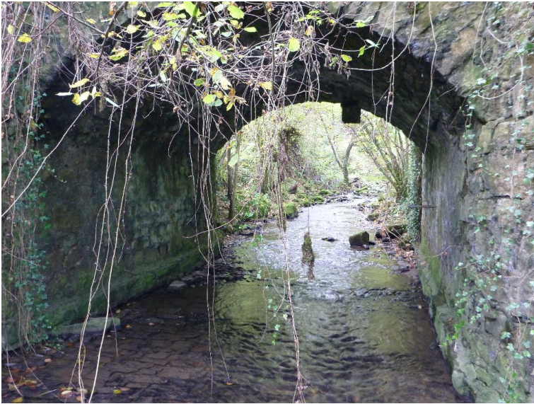
Durchlass; Ufer unterbrochen