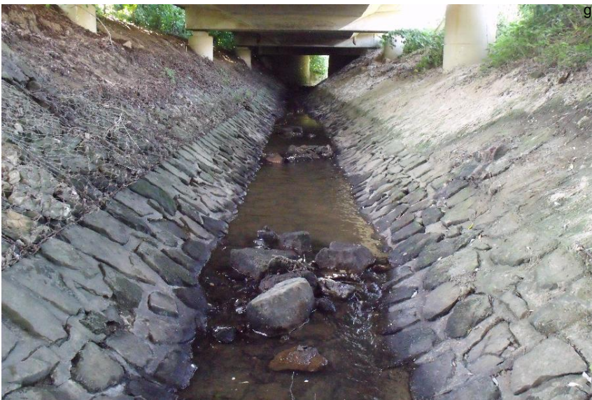
Durchlass; nicht strukturschädlich