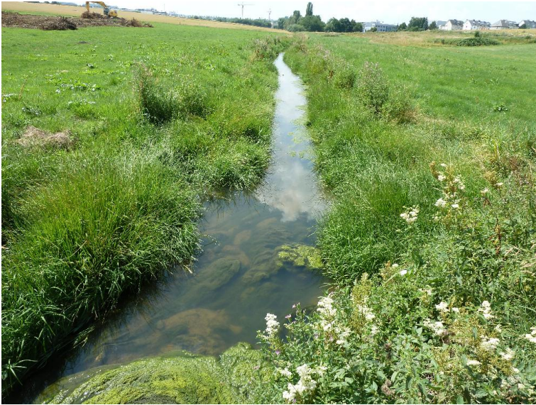
Algen - Gruenland - Krautflur, Hochstauden