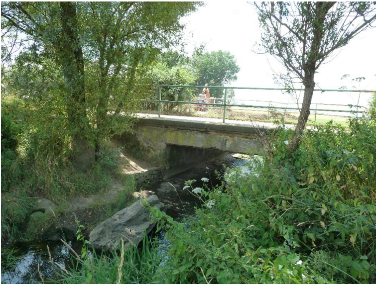
Durchlass; Ufer unterbrochen