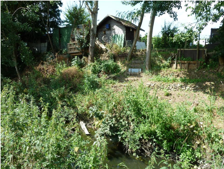
Bebauung mit Freifläche