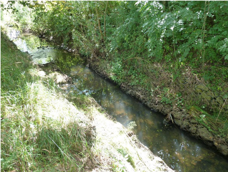
Uferverbau Steinsatz unverfügt