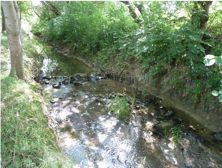
Absturz; kleiner - Laengsbank