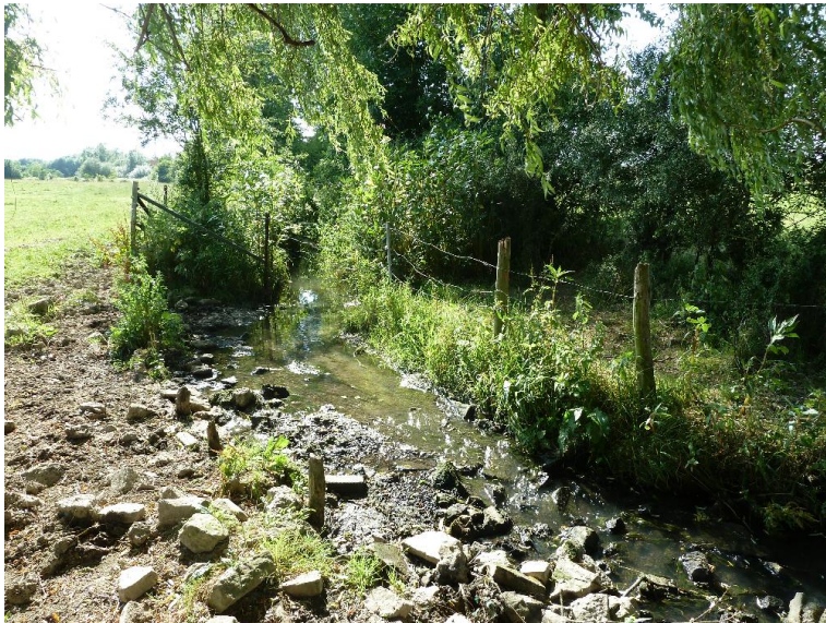
Trittschaeden - Gruenland