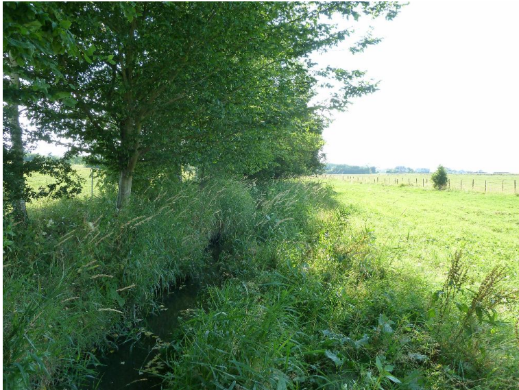
Gruenland - Krautflur, Hochstauden - Gebuesch