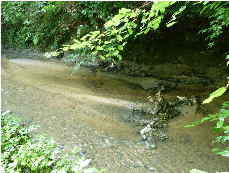
Bauschutt - Inselbank; Ansaetze