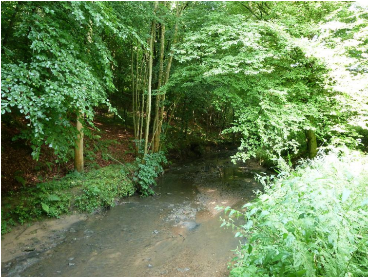
Inselbank - Laengsbank - Abbruchufer; natuerlich