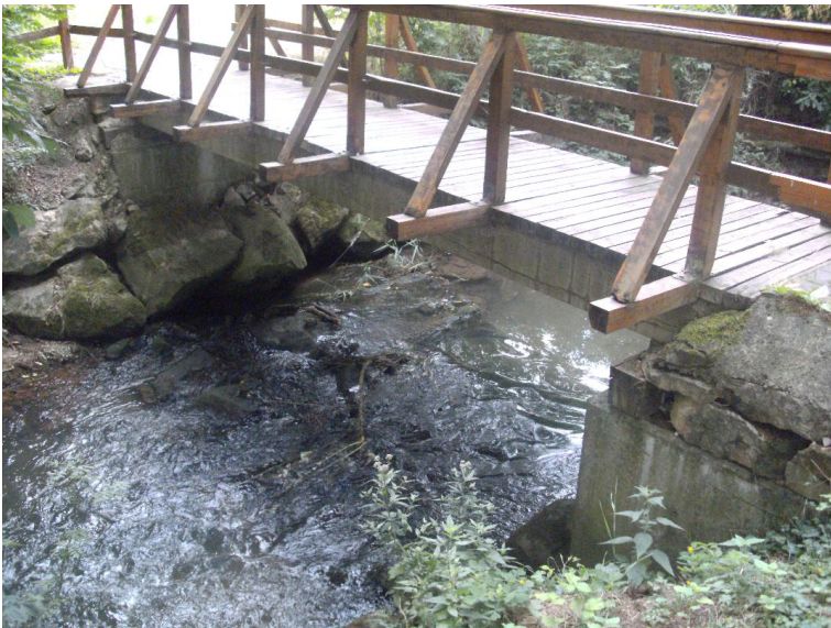
Durchlass; Ufer unterbrochen