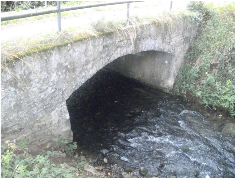
Durchlass; Ufer unterbrochen