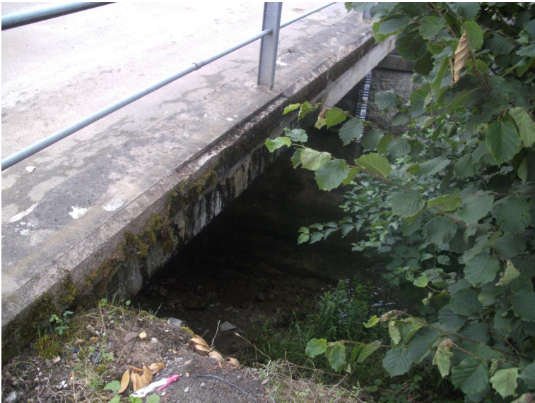
Durchlass; Ufer unterbrochen