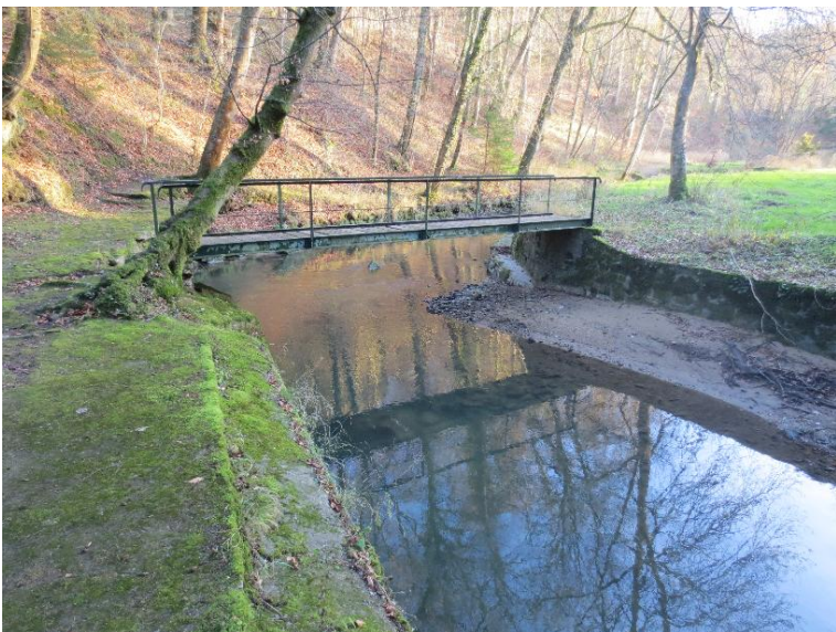
Durchlass; nicht strukturschaedlich